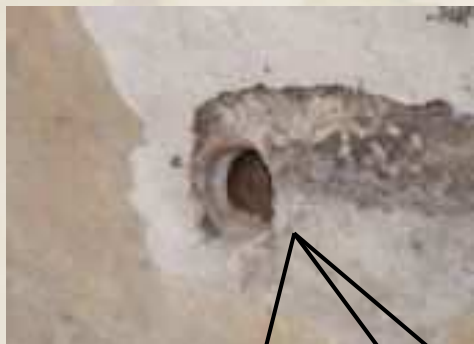
Injektáló furat a kápolna falában

A furatban elhelyezett injektáló csöveken keresztül juttattuk be a szükséges mennyiségű injektáló anyagot.